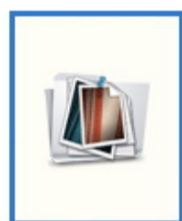
อ.นพ. ธีรสันต์ ดันดีเดมิท อีเมลล์