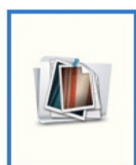
อ.นพ. นีรภัฏปี พิงโสภา อีเมลล์