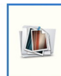
พญ. ดวงกมล พุทธคุณรักษา นายแพทย์ห้วงเวลา อีเมลล์