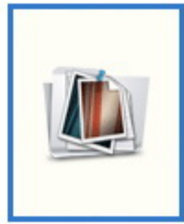
อ.นพ. เกียรติศักดิ์ ทัศนวิภาส นายแพทย์ห้วงเวลา อีเมลล์