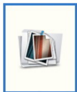
พญ. วาญน วัจนวิภาส นายแพทย์ห้วงเวลา อีเมลล์